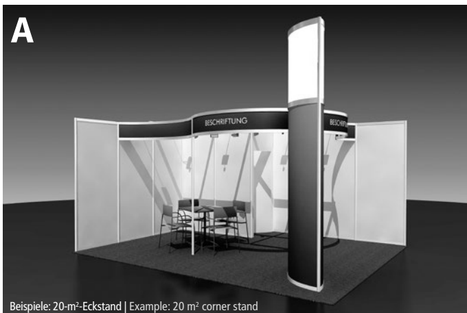
Beispiele: 20-m 2 -Eckstand | Example: 20 m 2 corner stand