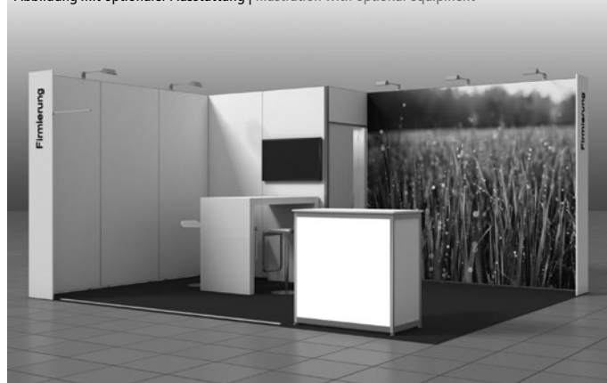
Abbildung mit optionaler Ausstattung | Illustration with optional equipment