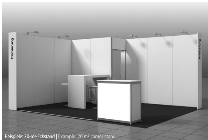
Beispiele: 20-m 2 -Eckstand | Example: 20 m 2 corner stand

Standform Stand variant Reihenstand Row stand Eckstand Corner stand